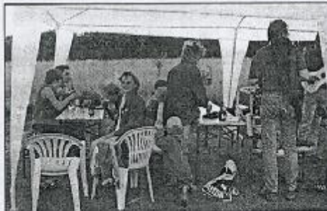
Trotz der vereinzelt Schauer wollten zahlreiche Besucherinnen und Besucher die Eröffnung des Aulendorfer Gartenlabyrinthes miterleben.

Beabsichtigt ist von den Organisatoren, die Einrichtung montags bis freitags 11 bis 19 Uhr sowie samstags und sonntags 10 bis 20 Uhr zu öffnen. Den Aulendorfer Sonnengarten findet man von Billerbeck aus in Richtung Beerlage fahrend. Vom Ortsausgangsschild Billerbeck nach etwa 2,5 Kilometern befindet sich das Feld auf der linken Seite (Aulendorf 1).